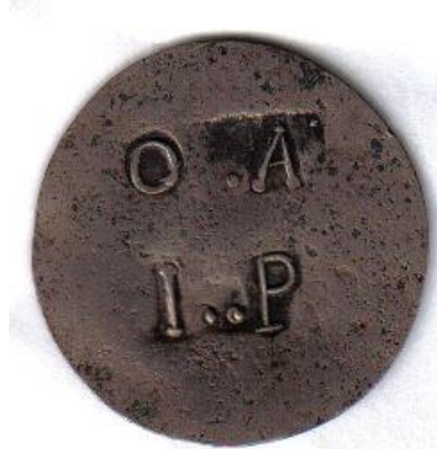
DISCO DE PLATA O..A DE 1 PESO COLECCIÓN DEL AUTOR (DIAM. 38 MM.)

Luego de algunos años de la publicación de mis trabajos relacionados con el tema (1 y 2), en los cuales logramos dilucidar el verdadero origen de estas enigmáticas piezas, presentadas por primera vez en 1919, por el erudito numismático José Toribio Medina en sus Monedas Obsidionales (3), he logrado reunir más antecedentes que ameritan este nuevo estudio. Éste complementa lo analizado en los trabajos anteriormente citados. Es importante mencionar que he sido citado en el principal catálogo de monedas Argentinas, en la sección Araucanía y Patagonia (4).