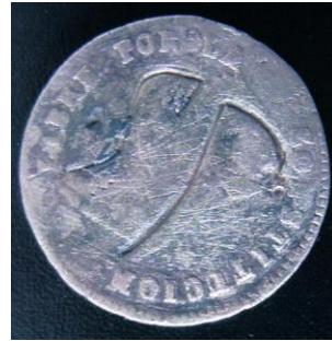
RESELLO FALSO BURILADO SOBRE 4 S. BOLIVIANO.