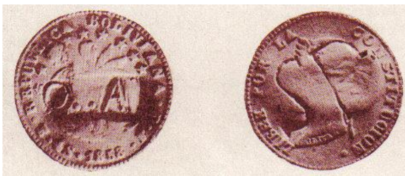
RESELLO O..A SOBRE MONEDA BOLIVIANA.

Burzio comenta que entre las características salientes de las monedas obsidionales son su tosquedad, metal empleado o materia que lo reemplaza distinto del usual y corriente, y también que el valor intrínseco es generalmente inferior al valor facial grabado. Esto se refleja en los discos de plata. Otras piezas que revisten carácter de necesidad, son las contramarcas o resellos. En este caso, resellos salitreros sobre moneda Boliviana y Chilena.