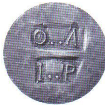
DISCO DE COBRE DE 1 PESO FALSO (39MM.).