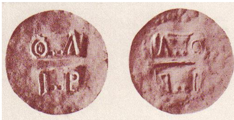
DISCO DE PLATA O..A DE 1 PESO FALSO (DIAM. 40 MM.).

existen falsificaciones del “O..A” sobre moneda boliviana, muy fáciles de reconocer, porque no se encuentra acuñado, sino burilado sobre una pieza de 4 sueldos.