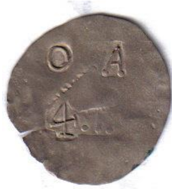
DISCO DE PLATA O..A DE 4.R (DIAMETRO 35 MM.).

Es una pieza “O..A” no conocida acuñada sobre un disco de plata. Abajo posee la impresión “4.R” (la R está con debilidad debido a la inclinación de cuño durante el golpe), que corresponde a un 4 reales perteneciente a la oficina Ángela.